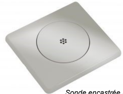
Sonde encastrée RS-D

Nouveautés et applications à découvrir sur le salon stand F5.