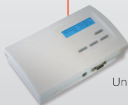
Unité centrale ZE