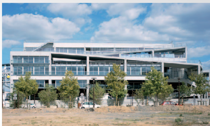
Tertiaire public ou privé, neuf ou rénovation... le système s'adapte au projet pour des gains réels et reproductibles.

Notre promesse : Mieux réguler votre chauffage.