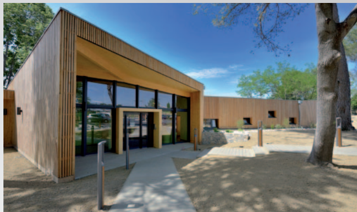
Crèche de Vaison-la-Romaine (84) labellisée BDM niveau Or régulée par ThermoZYKLUS avec gestion centralisée PCi.

Choisir ThermoZYKLUS, c'est l'assurance d'une qualité durable et d'un produit à forte valeur ajoutée dans une démarche de construction écologique, quels que soient l'émetteur et le projet.